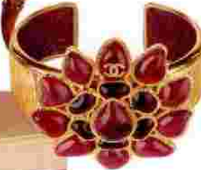
Βραχιόλι Chanel, Linea Piu.