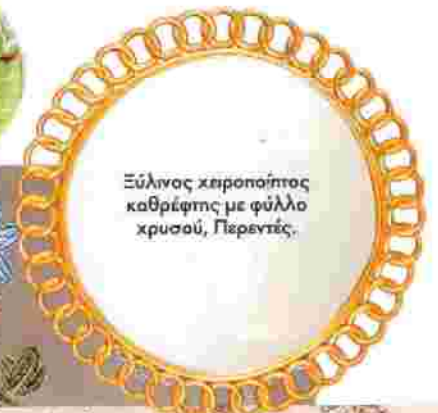
Ξύλινος χειροποίητος καθρέφτης με φύλλο χρυσού, Περεντίς.