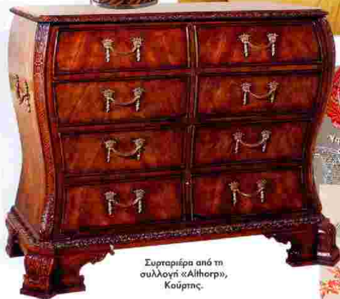
Συρταριέρα από τη συλλογή «Althorp», Κούρτης.