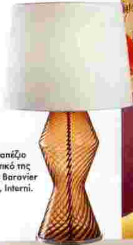
Επιπροπέζιο φωτιστικό της εταιρίας Baronnier & Toso, Interni.