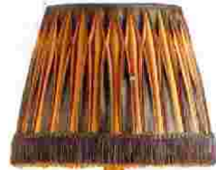
Φωτιστικό δαπέδου, Caleche.