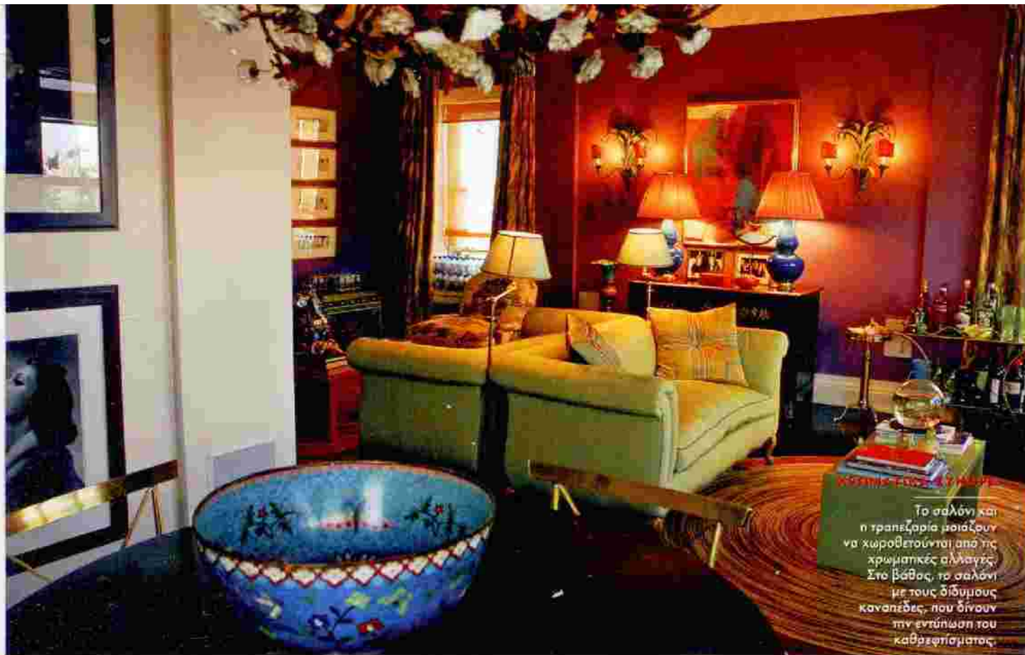
Το σαλόνι και η τραπεζαρία μοιάζουν να χωροθετούνται από τις χρωματικές αλλαγές. Στο βάθος, το σαλόνι με τους διδύμους καναπέδες, που δίνουν την εντύπωση του καθρεφτισματος.