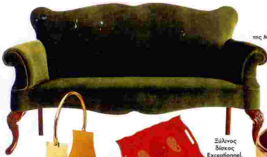
Καναπές από τη συλλογή «Upholstery», της Martha Stewart, Κούρτης.