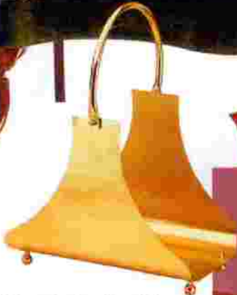
Αξεσουάρ τζακιού για ξύλα, της εταιρίας Comex, Ηλιόπουλος.